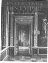
Ein Meisterwerk des Empire. Das Palais Beaux-Arts in Paris