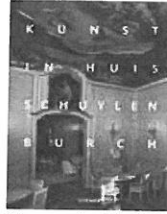
Kunst in Huis Schuylenburch