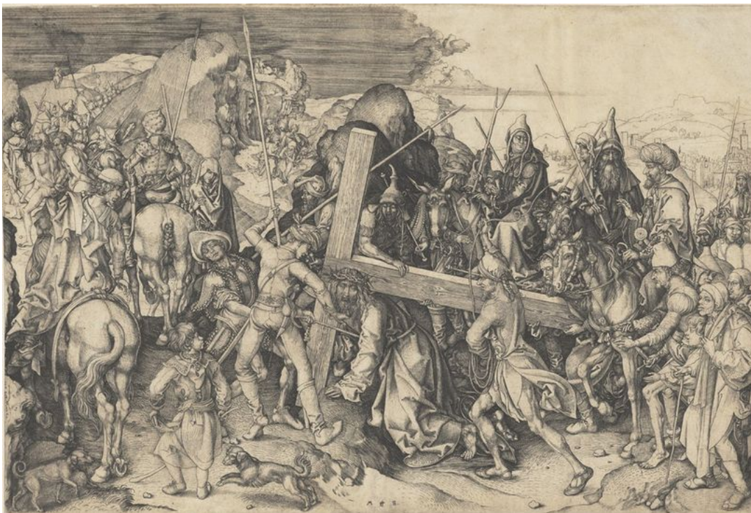
Martin Schongauer (vers 1445-1491), Le Grand Portement de Croix , 28,5 × 42,7 cm, Paris, musée du Louvre